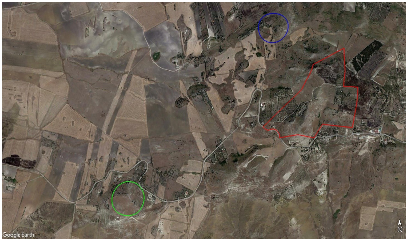
Figura 2. Parco Archeologico di Ramacca visto da Google Earth

L'area del parco denominata "Montagna", sul quale sono pensate le seguenti idee progettuali, si estende per 27,8 ettari, ad una quota compresa tra i 440 e 559 metri s.l.m. Per quanto riguarda il clima, sulla base della classificazione bioclimatica di Rivas-Martinez, il Parco Archeologico di Ramacca, si colloca nella fascia bioclimatica Termomediterranea secca con una temperatura media annua compresa tra 16 e 18°C e con precipitazioni medie annue comprese tra i 450 e 600 mm.