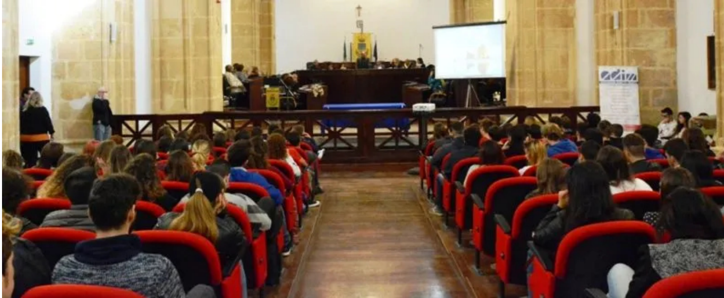
L'assemblea pubblica della precedente edizione